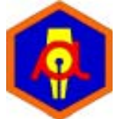
2. list / poročevalec