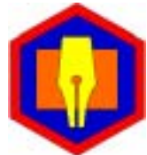
3. list / urednik glasila

nepomembnih, nezanimivih informacij ne bo bral ali poslušal ali gledal nihče.