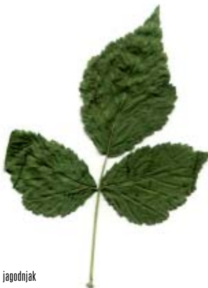
ozkolistni trpotec, vodna meta, jagodnjak