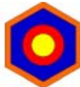
2. list / izletnik