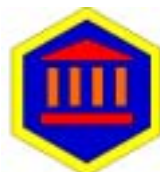
1. list / obiskovalec

Ja, taborniki so čudovit vir informacij o naši deželi. Glede na to, da obstaja taborniški rod v vsaki