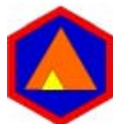
3. list / nastanjevalc